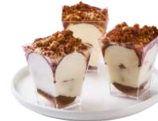
LES MINI VERRINES DE TIRAMISU

Crème vanille, biscuit cuillère aromatisé au Café & poudre de cacao