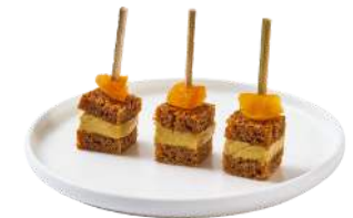
LES MILLEFEUILLES FOIE GRAS

Millefeuille de pain d'épices, Foie Gras & fruits confits