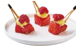
SAUMON GRIOTTE FRAMBOISE

Saumon infusé à la Griotte, crème de moutarde & Framboise fraîche