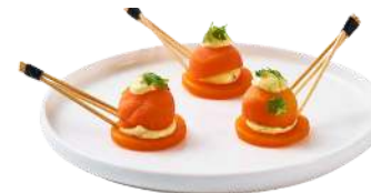
MILLEFEUILLES DE CAROTTE

Mille-feuille de Carotte, crème de curry & pousse de coriandre