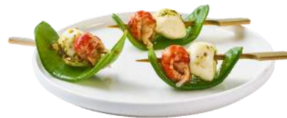
LES BOUCHÉES FRAÎCHEUR