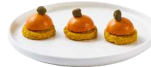
LES DÔMES DE POIVRONS

Sablé au curry, dôme de Poivrons & Pistache