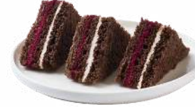
LES PAINS GOURMANDS