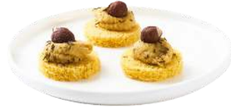
LES CANAPÉS TRADITION