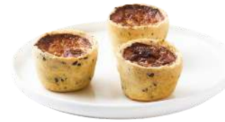
LES MINI QUICHES VARIÉES