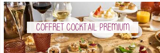
COFFRET COCKTAIL PREMIUM

Côté Salé : Mini Burgers froids au Bœuf, Navettes & Buns, Mini Pains Bretzel, Bouchées Fraîcheurs, Tartelettes Salées, Mille feuilles Foie Gras, Saumon infusé à la Griotte, Green Détox & Méli-Mélo de saison