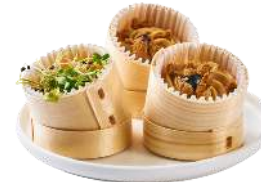
LES MINI VERRINES GOURMANDES