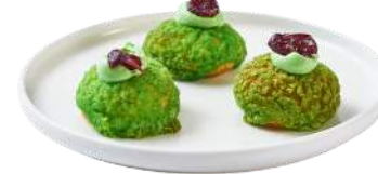
LES MINI CHOUX