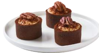
LES DÉLICES SUCRÉS