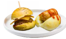
LES MINIS BURGERS & MINI HOT-DOGS (À TIÉDIR)

À tiédir par vos soins au micro-ondes ou au four