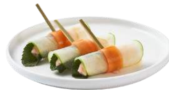
MINI ROULEAUX DE PRINTEMPS REVISITÉS