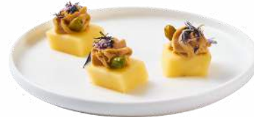
LES DÉS DE COMTÉ