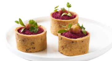
LES TARTELETTES SALÉES

Assortiment : Houmous à la Betterave, Pois Chiche mariné & Oignon • Patate douce & Poulet Tikka • Rillettes de Saumon, Crevette, beurre persillé & Oignon