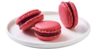
COUP DE COEUR POIRIER