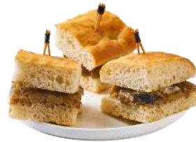
LES MINI FOCACCIAS