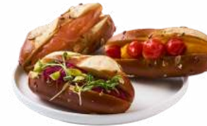
LES MINI PAINS BRETZEL