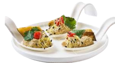
LES CUILLÈRES FANTASIES

Terre : Filet de Poulet, chutney, pistaches concassées & pointe de balsamique