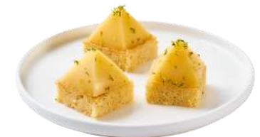
LES MINI MOELLEUX BRETON