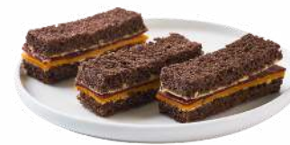
LES MINI SANDWICHS FINGER