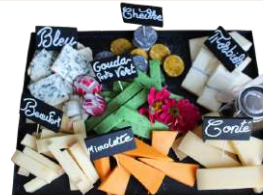
LE PLATEAU DE FROMAGES FRANÇAIS AOC

Méli-Mélô : Brie de Meaux • Chaource • Cantal • Livarot • Chèvre • Comté • Pont l'Évêque • Roquefort • Sainte Maure • Bleu d'Auvergne • Camembert de Normandie ou encore Reblochon, ... Pain & Condiments