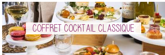
COFFRET COCKTAIL CLASSIQUE

Côté Salé : Tartelettes Salées, Saumon infusé à la Griotte, Green Détox, Navettes & Buns, Mini Pains Bretzel & Méli-Mélo de saison