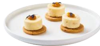
LES DÔMES DE CHÈVRES

Biscuit sablé salé, dôme de chèvre, confiture d'abricots & pétales de bleuets