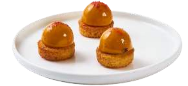
LES MINI SABLÉS