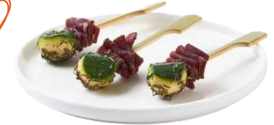
LES PICS BAMBOU

Assortiment : Pic Bresaola au thym & bille de Courgette rôtie • Pic bille de Carotte au cumin, Pomme de Terre au Paprika & bille de Courgette au thym • Pic Saumon & Radis blanc