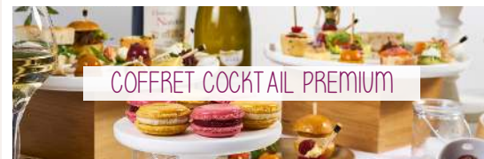
COFFRET COCKTAIL PREMIUM

Côté Salé : Mini Blinis, Tartelettes Salées, Saumon infusé à la Griotte, Green Détox, Mini Burgers froids au Bœuf, Navettes & Buns, Mini Wraps, Bouchées Fraîcheurs & Méli-Mélo de saison