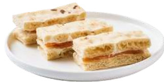
LES MINI SANDWICHS FINGER NORDIQUE

Pain polaire, Saumon ou Truite fumé & fromage frais aux herbes