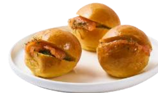
LES NAVETTES & BUNS