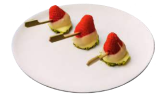
LES BROCHETTES DE FRUITS CHOCO PISTACHE