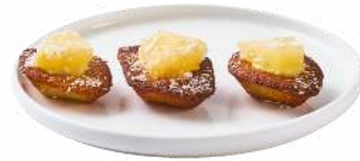
LES PETITS FOURS FRAIS TRADITION