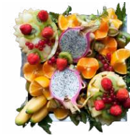
LA CORBEILLE DE FRUITS FRAIS "CARIOCA"

Assortiment de fruits frais exotiques & de saison découpés