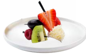
LES BROCHETTES DE FRUITS FRAIS

Exemples de duos de fruits selon les saisons.