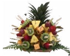
LE HÉRISSON FRAÎCHEUR