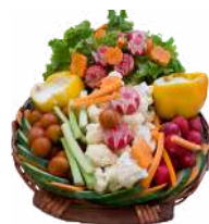
LES CORBEILLES DE CRUDITÉS

Tomate Cerises, Radis Blancs, Concombre, Choux-Fleurs, Céleri, Carottes & Poivrons