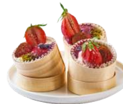
LES MINI VERRINES SUCRÉES GOURMANDES