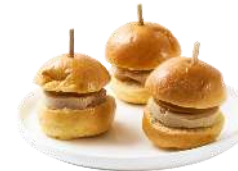
LES MINIS BURGERS (FROIDS)

Bœuf effiloché , Oignons frits, pousses de moutarde & sauce barbecue Saumon gravlax , coleslaw & sauce tartare Foie Gras & fruits exotiques Falafel , houmous citronné, pousses de coriandre & pointe de sauce piquante