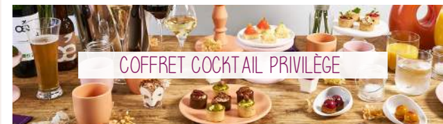
COFFRET COCKTAIL PRIVILÈGE

Côté Salé : Mini Wraps, Bouchées Fraîcheurs, Spécialités Pains Gourmands Mini Blinis, Tartelettes Salées, Mille feuilles Foie Gras, Dés de Conté de Foie Gras, Saumon infusé à la Griotte, Green Détox, Mini Burgers froids au Bœuf, Navettes & Buns, Épicéa (petit plat froid) & Méli-Mélo de saison