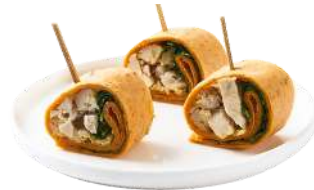
LES MINI WRAPS

Agrémentez votre cocktail avec du Champagne, Vin Blanc, Rouge, Rosé, Bières & Softs