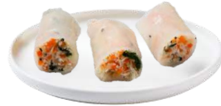
MINI ROULEAUX DE PRINTEMPS VÉGÉTARIEN

Mélange de Carottes, vermicelles de riz, soja, menthe & grains de sésame