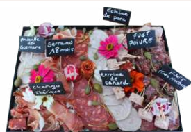
LE PLATEAU DE CHARCUTERIE

Méli-Mélo : Chorizo • Bœuf séché • Rosette • Fuet • Saucisson sec, ... Pain & Condiments