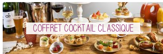
COFFRET COCKTAIL CLASSIQUE

Côté Salé : Bouchées Fraîcheurs, Mini Blinis, Spécialités Pains Gourmands, Dôme de Poivrons, Mini Burgers froids au Bœuf & Méli-Mélo de saison