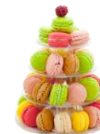
LA PYRAMIDE DE MACARONS