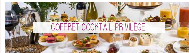
COFFRET COCKTAIL PRIVILÈGE

Côté Salé : Mille feuilles Foie Gras, Panna-Cotta aux Poivrons, Spécialités Pains Gourmands, Tartelettes Salées, Saumon infusé à la Griotte, Green Détox, Mini Burgers froids au Bœuf, Navettes & Buns, Mini Wraps, Épicéa (petit plat froid) & Méli-Mélo de saison